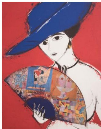
Manolo Valdés Pamela I , 2013 Farbradierung mit Collage 119 x 93 cm 50 Ex., signiert

Eröffnung: Freitag, 7. September, 19 Uhr