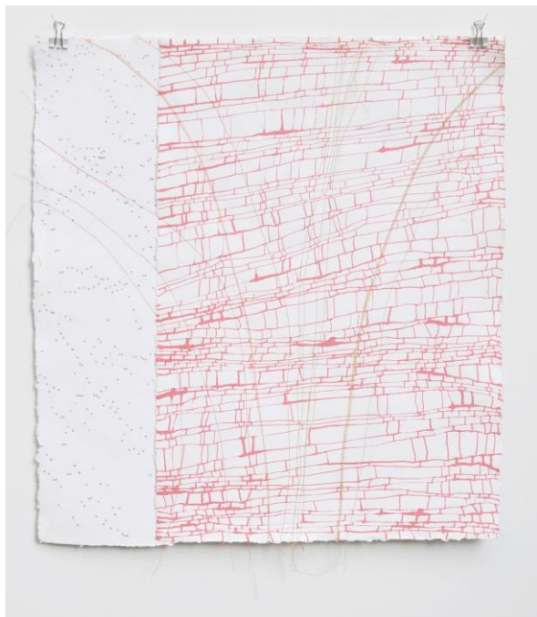
Andrea Ostermeyer, bambou, 2016, Federzeichnung, Garn, Schreibmaschine, auf Bütteln, 55 x 51 cm